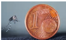
Taille réelle

Introduit en France métropolitaine en 2004 dans les Alpes-Maritimes, le moustique vecteur Aedes albopictus est, en 2014, présent dans cinq régions 1 et sa zone d'implantation est en expansion constante.