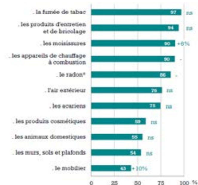
Identification des polluants de l'air intérieur et évolution par rapport à 2007

* Parmi les personnes qui en ont déjà entendu parler