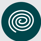
Serpentins à l'extérieur