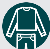
Vêtements amples et couvrants